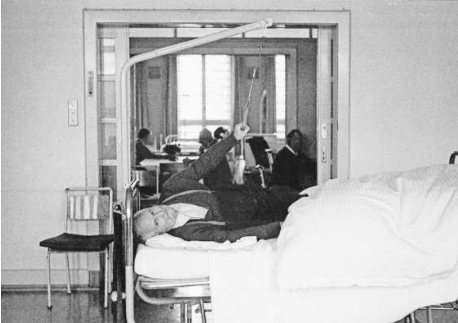
Eindringliche Bilder aus dem Burghölzli: ein Mann, dem wegen eines Tumors der halbe Kiefer fehlt, und ein Patient, der den Bügel nicht loslassen will, weil er Halt gibt.